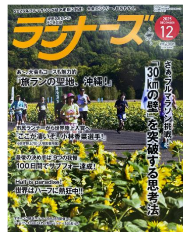
月刊ランナーズ 2025 表紙

※「RUNNET」大会レポートは、日本最大級のランニングポータルサイトで、ランニング大会に参加し実際に走ったランナーの皆さんによる、大会の評価と感想を掲載するサイトです。