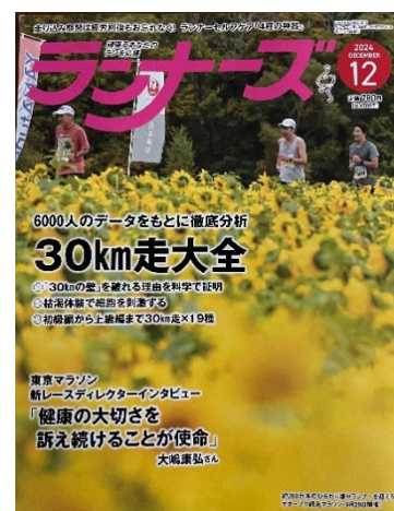
月刊ランナーズ 2024 表紙

※「RUNNET」大会レポートは、日本最大級のランニングポータルサイトで、ランニング大会に参加し実際に走ったランナーの皆さんによる、大会の評価と感想を掲載するサイトです。