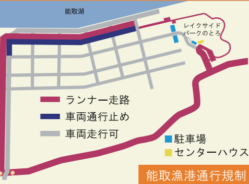
能取漁港通行規制